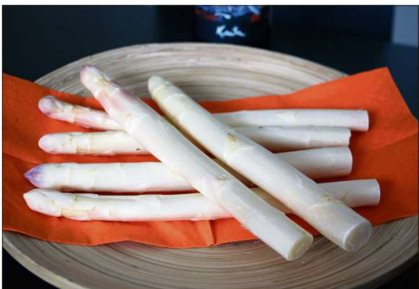
dat gio las aspargias grischunas e chegl gist dretg sen Pasca. Bun appetat!

aspargias e chest onn ò gio scumanzo la raccolta. Taglea las ampremas aspargias ins vegia igls 3 d'avregl, dei la feglia digl pour. Chegl seian tuttegnas dus emdas pi bod tgi usito. Cun esser gio pi dei las temperaturas pi ampernevas creschan las aspargias damai considerablamaintg pi bod, chegl tgi allegra betg angal igls gourmets, mabagn er blets oters tgi gioldan la delicatessa roiala an tot las furmas cuschinadas e chegl cun u sainza sosas.